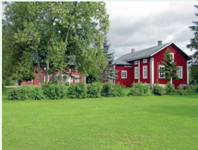
Haapaniemen hiippakuntakartano toimii tärkeänä koulutuskeskuksena

Nyt on aika ryhtyä tutustumaan vuoden 2012 koulutus- ja neuvottelupäivätarjontaan. Kaikki koulutukset ja neuvottelupäivät on julkaistu netissä ilmestyneessä henkilöstökoulutuskalenterissa. Erillistä paperiversiota ei paineta.